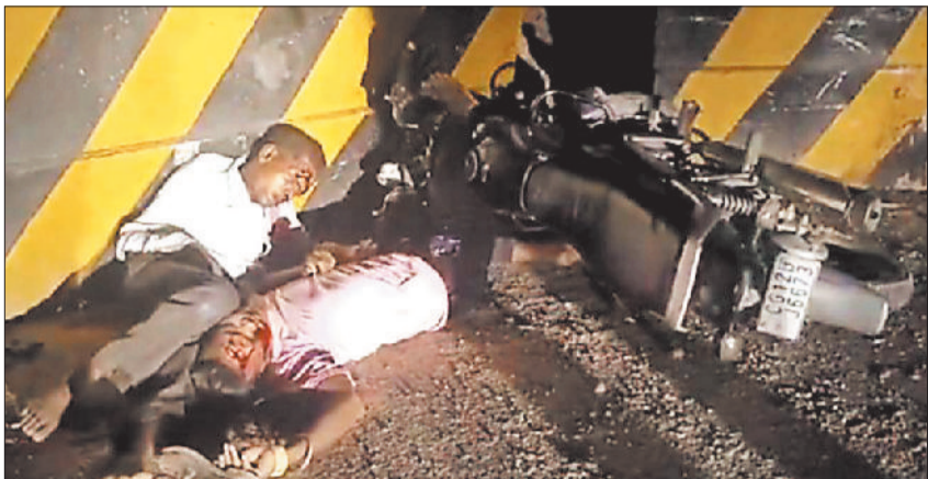
सड़क हादसे में मृत पिता व पुत्र।