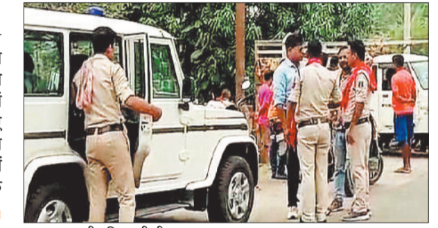
पूछताछ करती पुलिस की टीम।