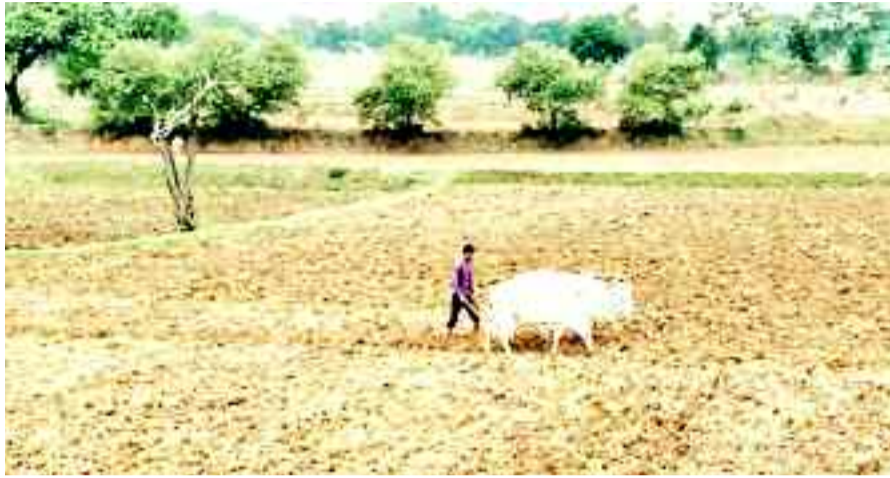
खेती-किसानी कार्य में जुटे किसान।

हालांकि तीन-चार दिनों से प्रतिदिन आसमान में बादल छा रहे हैं, लेकिन हल्की बूंदबांदी के बाद बादल छंट जा रहे हैं। बादलों के कई दिनों से दिनभर छाए रहने एवं हल्के बादलों के कारण तापमान का पारा 40 डिग्री से नीचे लुढ़क गया है, लेकिन उमस भरी गर्मी से लोगों को राहत नहीं मिल पा रही है। इस दौरान लोगों को घर में कूलर से ही राहत मिल रही है। यदि बीच में बिजली गुल हो जाती है तो पसीने से तर बनना पड़ रहा है। जिले में कुछ दिनों से जिस तरह से बादल छा रहे हैं, उसे देखकर ऐसा लगता है कि अब बारिश होगी, काले घने बादलों